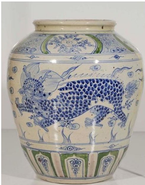
(Bộ sưu tập TAT, cao 38cm)