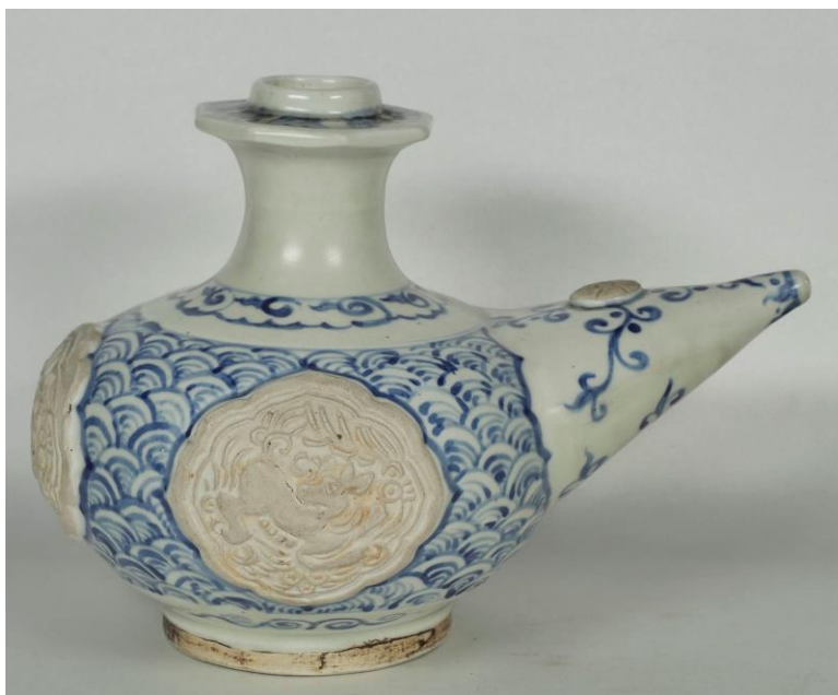
(Bộ sưu tập TAT)

Thứ ba là kendi tam thái với mẫu song phượng, sắc sảo, hiếm quý, còn cả men vàng là loại men dễ phai mờ theo năm tháng so với men xanh lục và men đỏ.