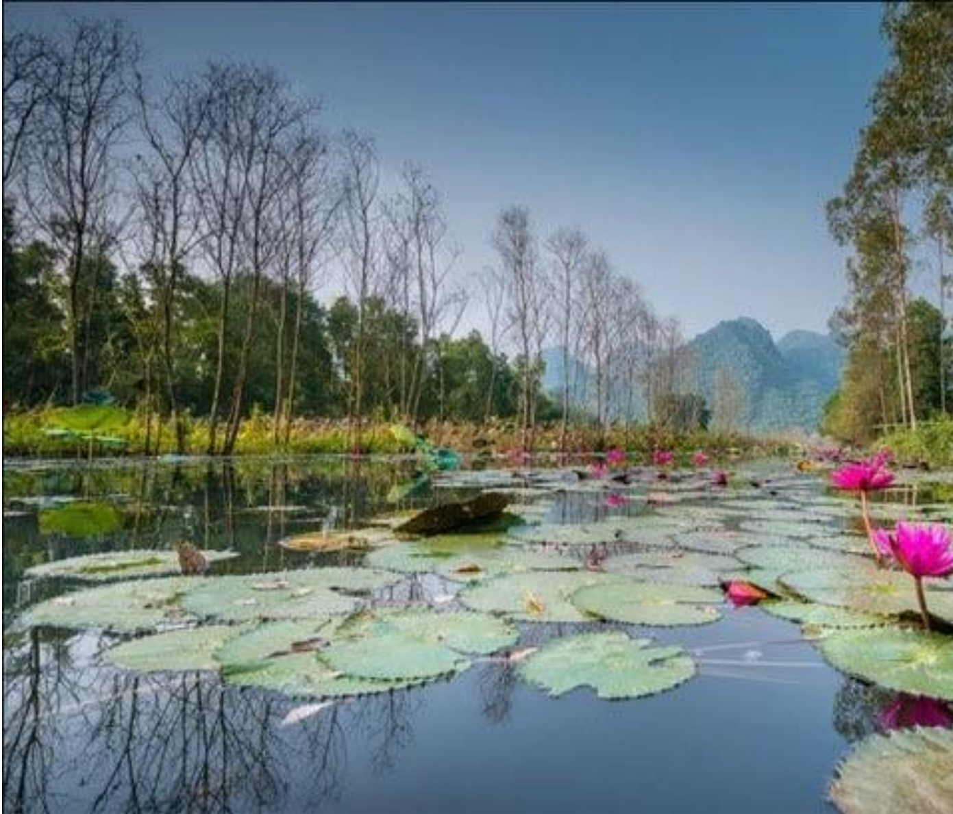
Suối Yến gần chùa Hương vào mùa Thu

Cũng như rừng phong ở Canada, vào thu, lá cây phong nửa vàng, nửa đỏ bắt đầu rơi: