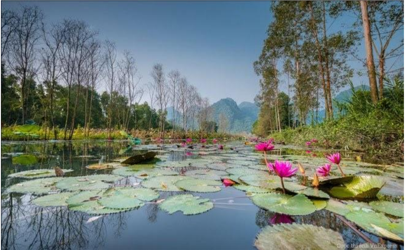
Suối Yến gần chùa Hương vào mùa Thu